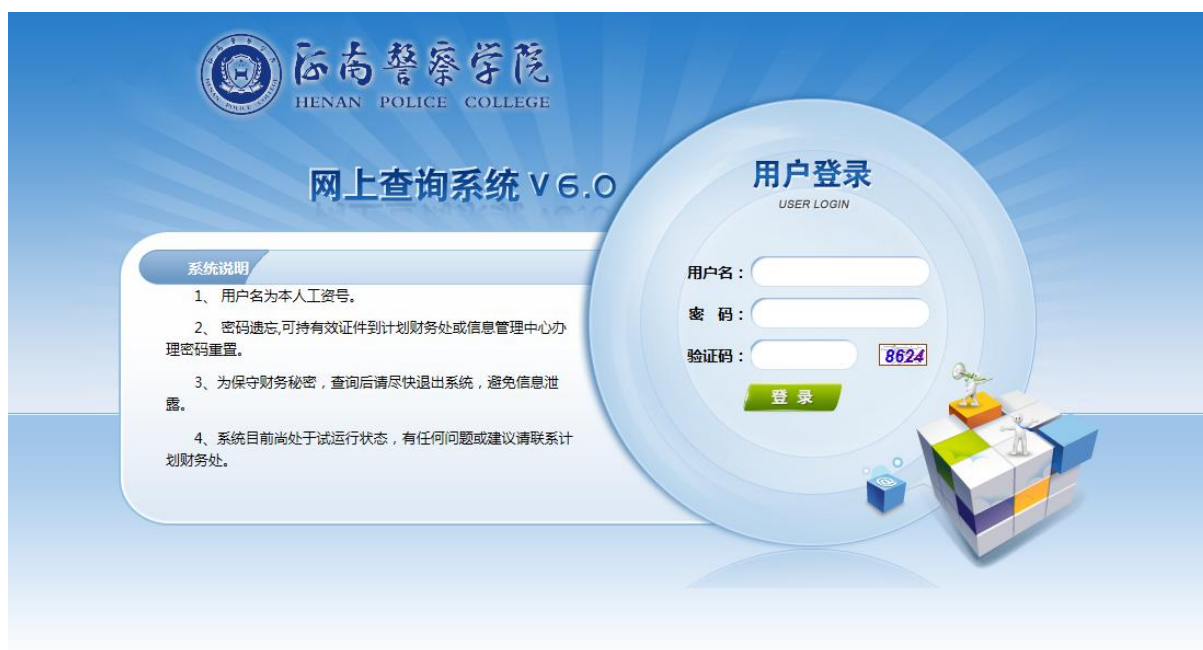
图 5. 河南警察学院财务信息综合查询系统

及时发布河南警察学院 2021 年部门预算情况和 2020 年度部门决算情况，包含收支决算总表、收入决算表、支出决算表、财政拨款支出决算表、收支预算总表、收入预算表、支出预算表和财政拨款支出预算表等，并对表格内容及专业术语进行文字解释，便于公众了解相关信息，接受社会监督。