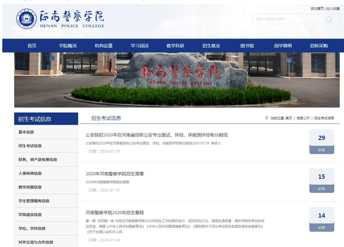
图 2：河南警察学院招生网站

放。在招生宣传工作期间共计发放招生宣传材料 8000 余册。五是利用新闻媒体直播访谈宣传我院 2021 年招生政策和招生计划，通过参加省委、省政府门户网站大河网“高招有高招”栏目、网易新闻直播“高校来支招”、河南广播电视台（大象新闻）和河南广播电台高招直播活动进行宣讲，通过官微官媒直接发声，杜绝网络谣言和不实信息。六是举行“校园开放日”活动，同时通过河南法制报全程现场直播，展示各系部进行实验实训室和场馆，让考生和家长充分了解招生政策、系部专业，亲身感受校园文化和校园环境等。