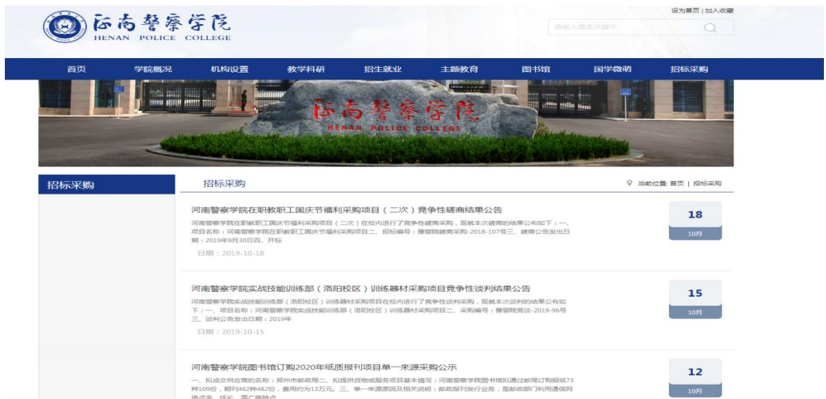
图 4：河南警察学院校内招投标公示情况

本年度，学校进一步加大财务信息公开力度，通过财务信息综合查询系统，为教职工提供更便捷的服务。依据《关于进一步完善中央财政科研项目资金管理政策的若干意见》（中办发〔2016〕50号）文件精神，进一步优化线上服务，做好线下普及，多层次公开财务相关政策。按照财政厅要求对平台进行了升级，下一步将与OA协同办公系统进行对接，实现网络在线报账、申报预算。