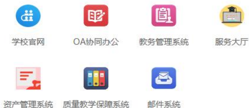
图 1：学院信息门户信息管理系统一览

核系统、职称评定系统、毕业生质量跟踪与服务管理信息系统、迎新系统、离校系统、校友系统等信息化管理系统已进入测试阶段，下一步，学院拟推出通知公告和校内公文在线签收平台。自2017年来学院智慧校园信息化建设的稳步推进，为信息公开工作奠定了坚实基础。